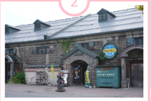
小樽ビール 小樽倉庫No.1

穀物倉庫を改装した醸造所に併設のビアホール。小樽で最初の地ビールであり、ドイツのビール純粋令に基づいて作る、本物のドイツビールと、地元の食材を使用した料理が楽しめます！スタンプにはバイト姿の六花が！