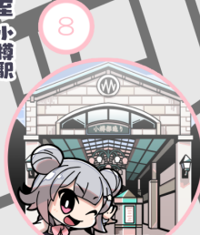
スタンプ設置場所 都通り商店街事務所前 1階入り口